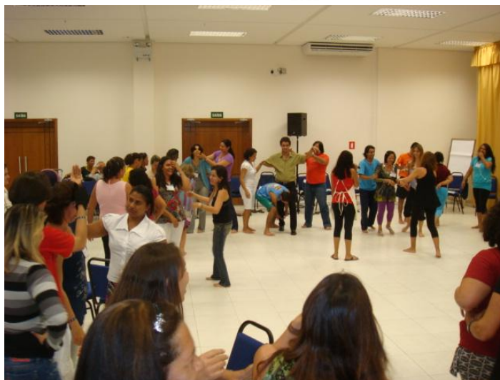
“Figura 01” - Grupo de Estudos Curriculares

As orientações curriculares para a arte no Estado de Goiás não pretendem, e tampouco conseguem, trazer respostas para todas as questões, mas propõem caminhos, levantam e geram questionamentos. Fundamentadas numa perspectiva dialógica, convidam ao desafio de construir uma sociedade mais democrática e visam práticas de justiça social e igualdade de direitos culturais, fortalecendo a liberdade intelectual e a imaginação criativa dos sujeitos. Isso só se torna possível por meio de ações pedagógicas que incluem os sujeitos e lhes permitem estabelecer relações, suscitar suas memórias, rever seus trajetos, pensar no presente, construir posicionamentos e projetos de vida.