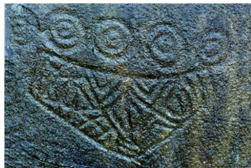
Figura 3: Representação dos conhecimentos prévios expressada pela maioria dos estudantes entrevistados: arte rupestre como primeiros ensaios para a história da geometria. (Adaptado de Mendiola, 2002).